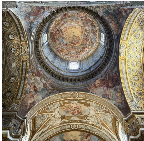
La cúpula de Borromini, con frescos de Pasquale Marini — el tambor, y el célebre campanario exterior, están entre las últimas obras de Borromini.