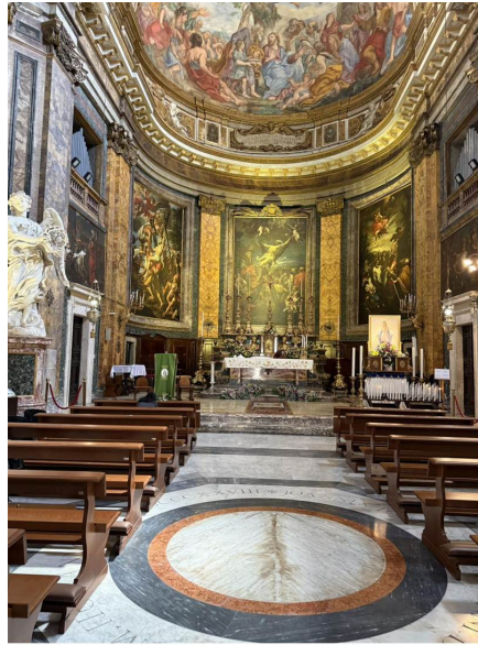
La nave hacia el altar mayor, con su ciclo de pinturas del martirio de San Andrés.

Ubicación: Via di Sant'Andrea delle Fratte, cerca de la Escalinata, Roma