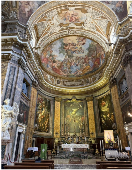
El presbiterio: las pinturas de San Andrés, un ángel de mármol de Bernini a la izquierda, y (a la derecha) la venerada Madonna del Miracolo.