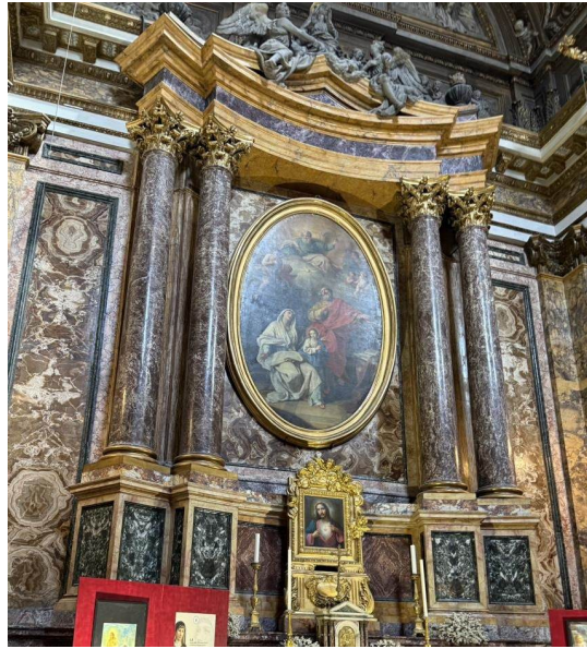
La Capilla de Santa Ana, con una figura yacente de mármol bajo el altar, de Giovanni Battista Maini.