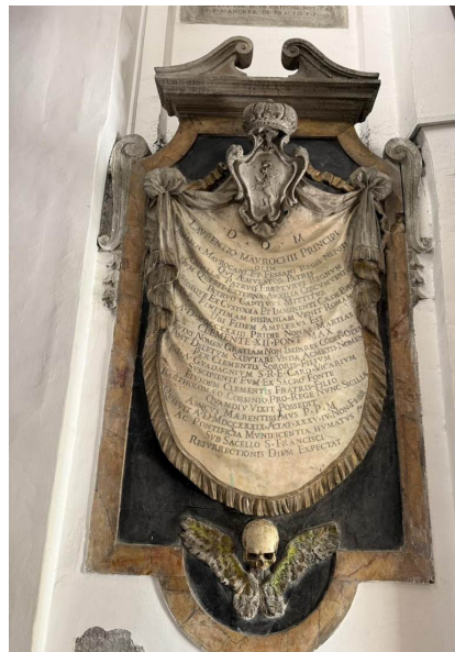
El monumento del príncipe Lorenzo Mauroceni — un nieto bautizado del rey de Fez (m. 1739) — coronado por una calavera alada.