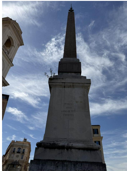
El Obelisco Salustiano — una copia romana de un obelisco egipcio, erigido aquí en 1789.