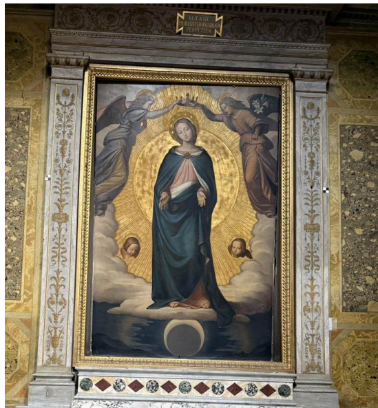
Un retablo de la Inmaculada Concepción, la Virgen coronada por ángeles sobre la luna creciente.