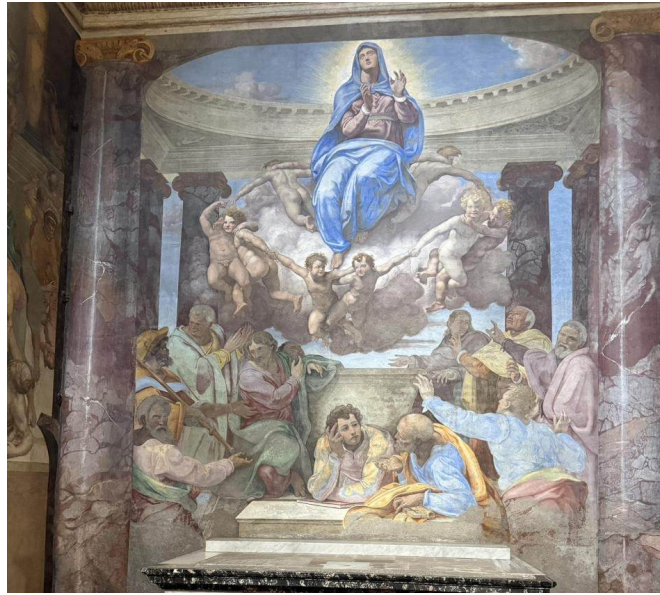
La Asunción de la Virgen de Daniele da Volterra (1548–50), en la Capilla de Lucrezia della Rovere — que se dice incluye un retrato de Miguel Ángel entre los apóstoles.

Ubicación: Iglesia de Trinità dei Monti, en lo alto de la Escalinata, Roma