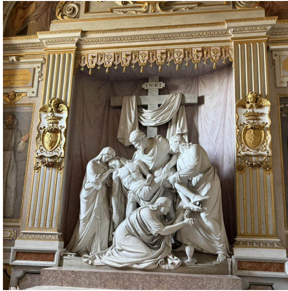
Un Descendimiento en mármol — Cristo bajado de la Cruz — en una capilla lateral.