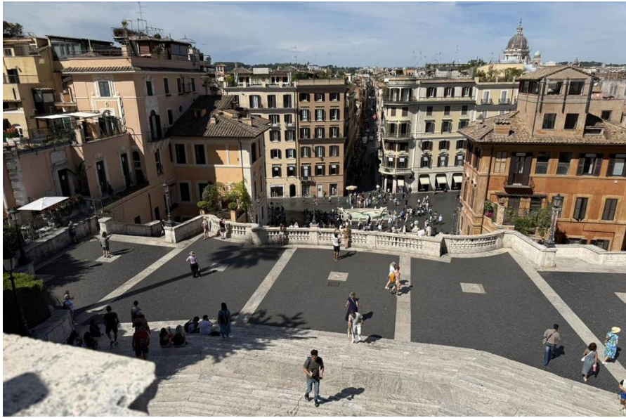
La vista desde lo alto, escaleras abajo hacia la Piazza di Spagna y sobre los tejados de Roma.