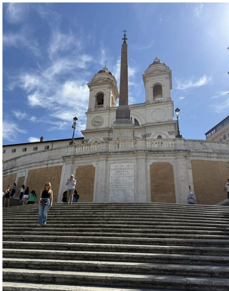
La fachada de dos torres de Trinità dei Monti, la iglesia francesa del Pincio, con el obelisco delante.