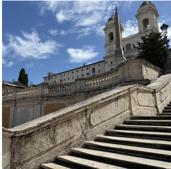
La Escalinata que asciende hacia la iglesia de Trinità dei Monti y el obelisco Salustiano — diseñada por Francesco De Sanctis y construida en 1723–26.

Ubicación: Scalinata di Trinità dei Monti, entre la Piazza di Spagna y el Pincio, Roma