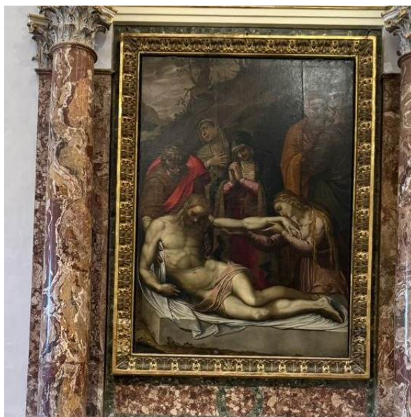
La Lamentación sobre Cristo muerto, un retablo del siglo XVI de Cristoforo Roncalli, llamado Pomarancio.