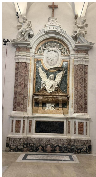
La tumba del cardenal Cinzio Aldobrandini (1705–07): un esqueleto alado de la Muerte que se alza sobre el sarcófago, tallado por Pierre Le Gros el Joven.