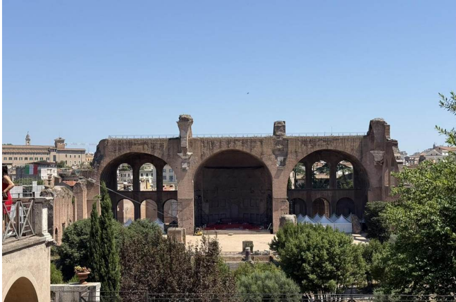
La Basílica de Majencio — los tres colosales arcos con casetones de su nave norte conservada.

Ubicación: En el extremo oriental del Foro Romano, sobre la Velia, Roma