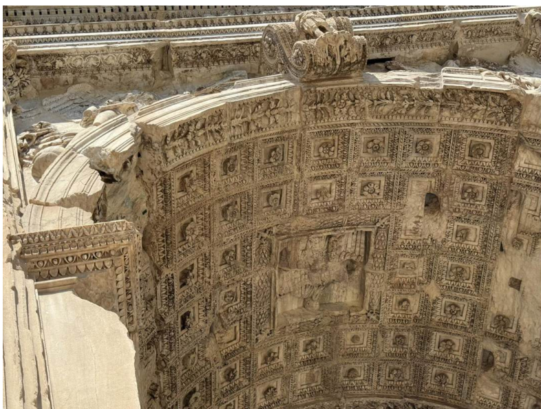
La bóveda de casetones, con la apoteosis de Tito — el emperador llevado al cielo sobre un águila — en el panel central.