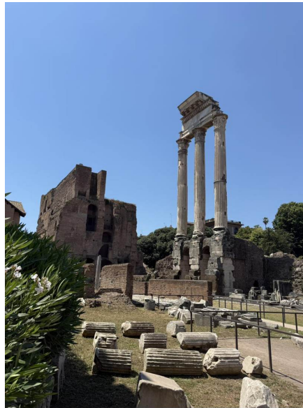
Las tres columnas que se conservan del Templo de Cástor y Pólux, prometido tras una legendaria victoria de la caballería en el 484 a.C.