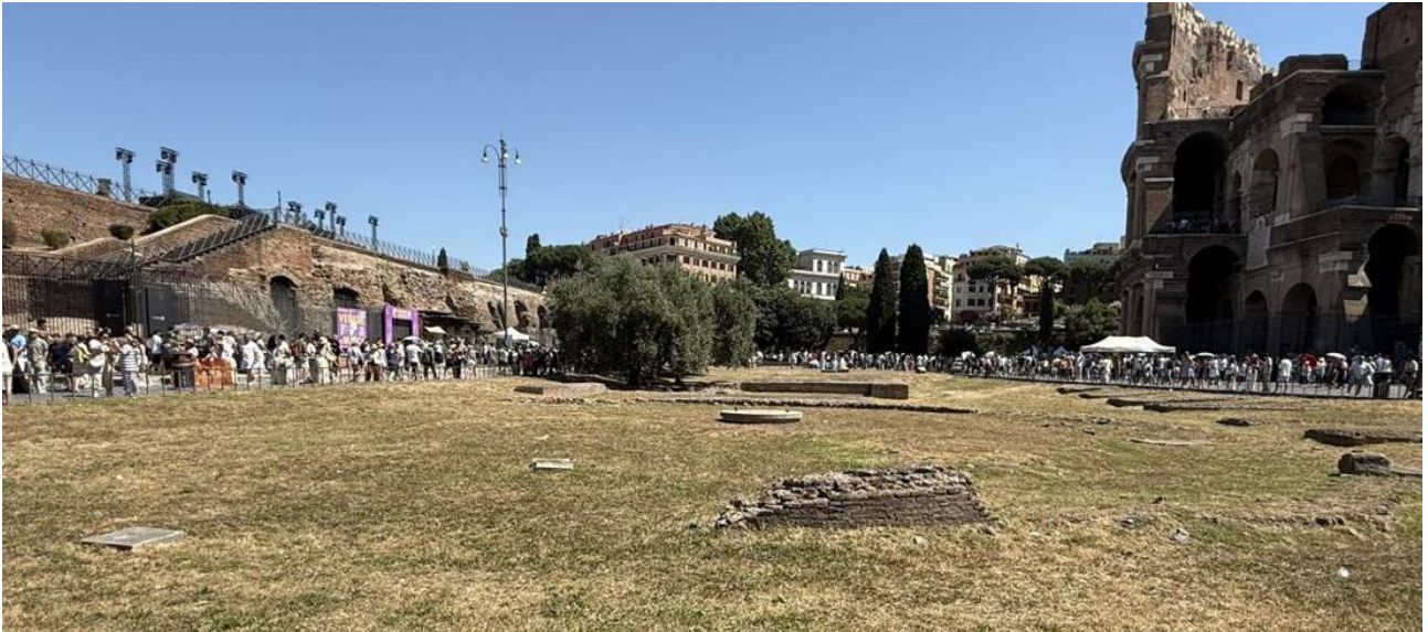
El valle del Coliseo: la larga plataforma de ladrillo del Templo de Venus y Roma (izquierda) junto al Coliseo (derecha).