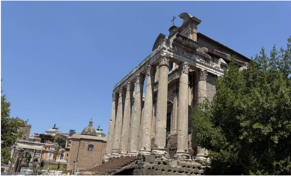
El Templo de Antonino y Faustina (141 d.C.), cuyas columnas encerraron después la iglesia de San Lorenzo in Miranda; el arquitrabe reza DIVO ANTONINO ET DIVAE FAVSTINAE EX S C.