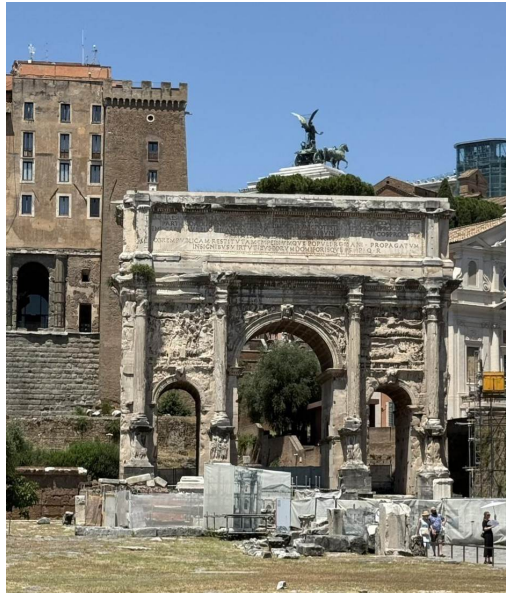
El Arco de Septimio Severo (203 d.C.) — un arco triple por las victorias partas; la cuarta línea de la inscripción aún muestra dónde se borró el nombre del asesinado Geta.

Ubicación: A lo largo de la Via Sacra, el Foro Romano, Roma