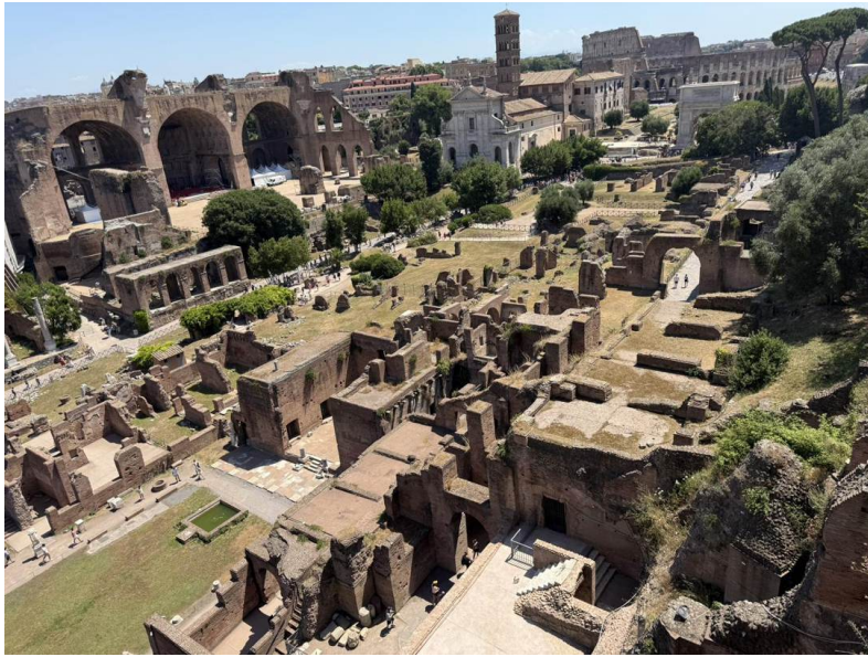
Mirando al este hacia el Coliseo: la Basílica de Majencio (izquierda), el campanario de Santa Francesca Romana sobre el Templo de Venus y Roma, y el Arco de Tito (derecha).