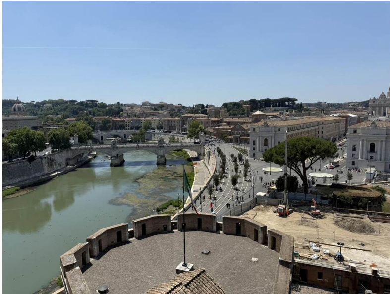
Mirando el Tíber: el río se curva junto al Ponte Vittorio Emanuele II, con la cúpula de San Pedro alzándose a la derecha.

Ubicación: Las terrazas del Castel Sant'Angelo, Roma