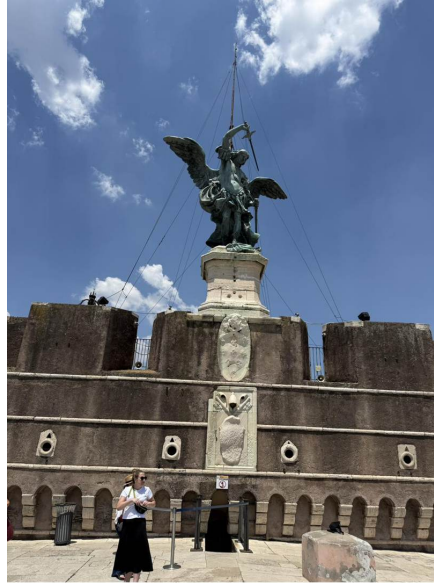
El Arcángel Miguel de bronce, de Verschaffelt (1753), en la cima — el ángel que da nombre al castillo.

La Sala Paolina, el gran salón con frescos de los aposentos papales construidos para el papa Paulo III.