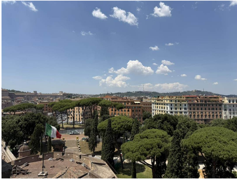
Sobre el bastión artillero del castillo y los pinos piñoneros hacia los tejados de Prati y la colina del Janículo.