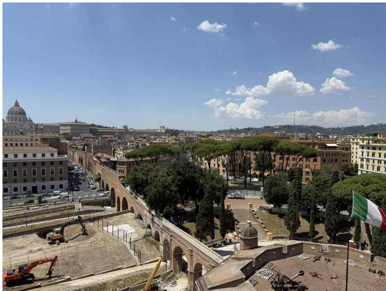
El Passetto di Borgo — el corredor fortificado hacia el Vaticano — se dirige hacia la cúpula de San Pedro.