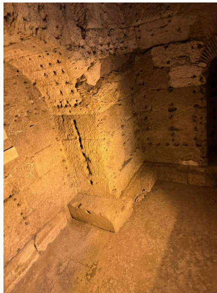
El núcleo romano desnudo — una masa de sillería salpicada de los huecos que sujetaban su revestimiento de mármol.