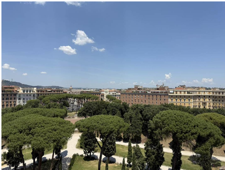
Los pinos piñoneros de los jardines del Parco Adriano, justo debajo de las murallas.