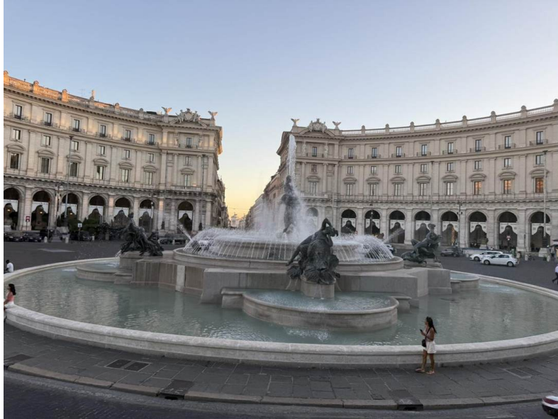
La fuente completa al anochecer, en las columnatas curvas de la Esedra de la Piazza della Repubblica.

Ubicación: Centro de la Piazza della Repubblica, Roma