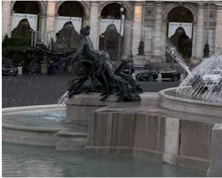
Detalle (ampliado) — una náyade recostada sobre su criatura acuática, a la izquierda de la pila.