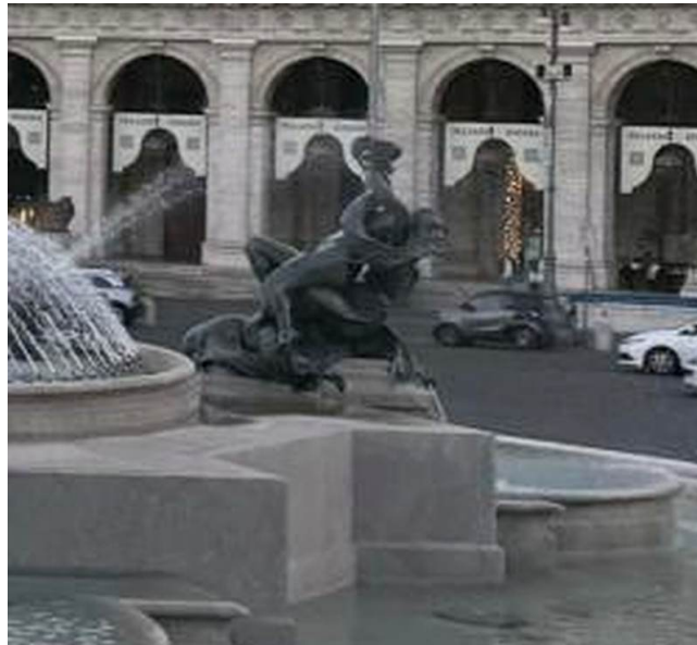
Detalle (ampliado) — una náyade a lomos de un caballo marino, a la derecha de la pila.