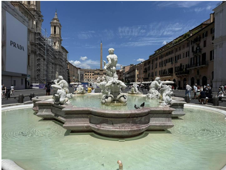
Hacia el norte — el Moro de espaldas, con el obelisco de la Fuente de los Cuatro Ríos al fondo.