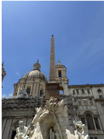
Mirando hacia arriba — el obelisco egipcio coronado por la paloma de bronce de los Pamphilj con una rama de olivo.