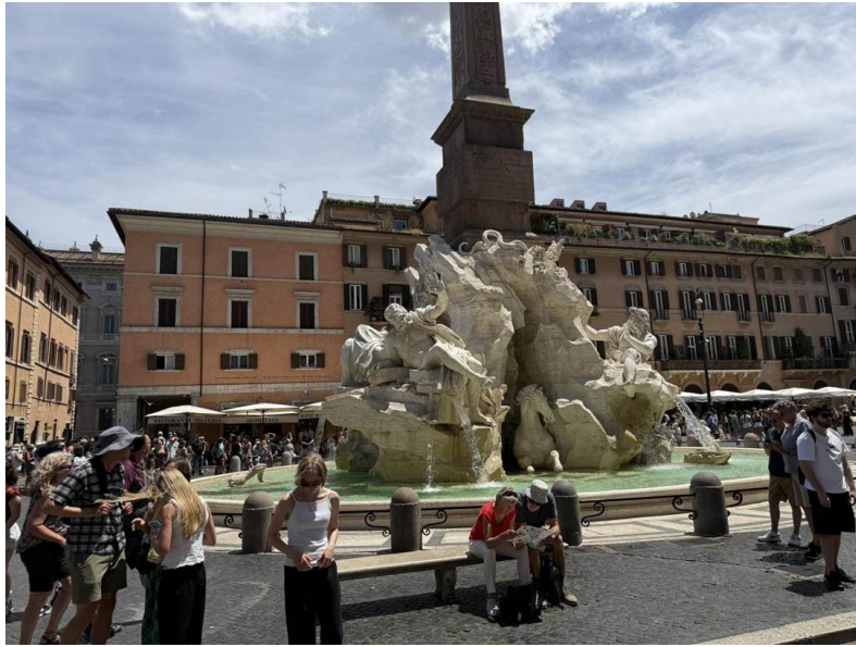
Desde el lado opuesto — un caballo irrumpe del travertino entre las figuras.