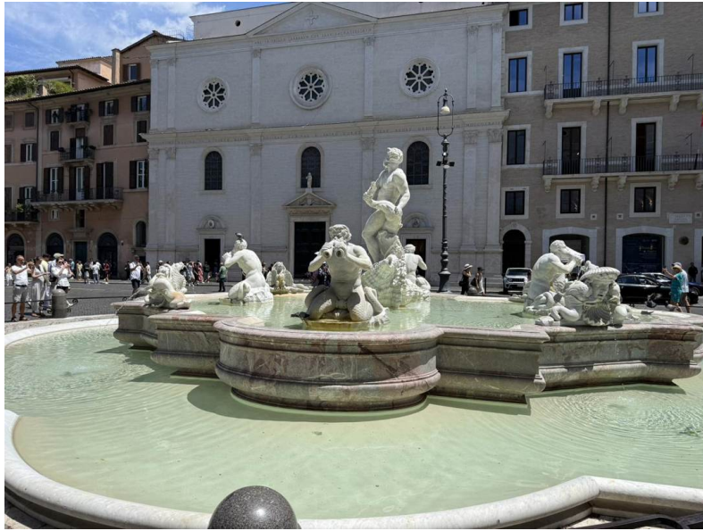
Reverso — la espalda del Moro y un mascarón marino; detrás se lee la inscripción de la iglesia.