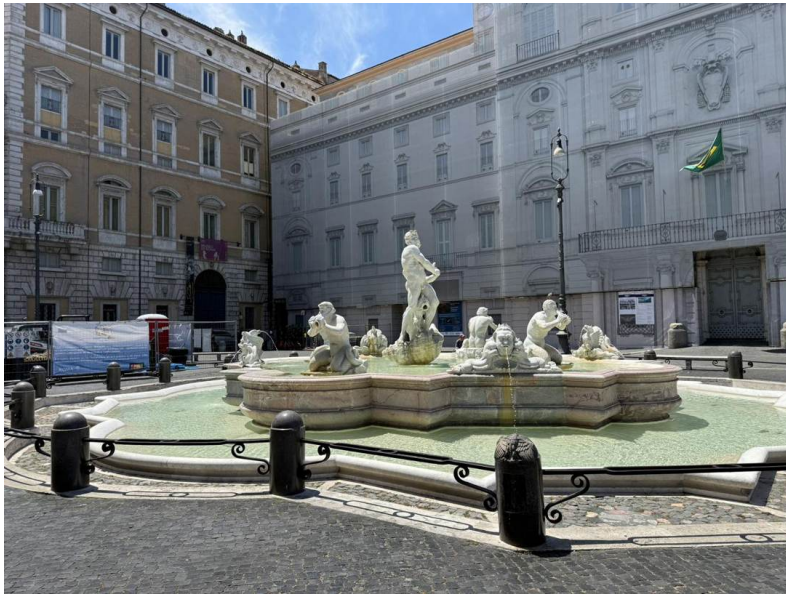
Latera — la pila lobulada completa con los cuatro tritones, ante el Palazzo Pamphilj.