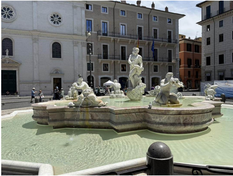
Frente — el Moro mira hacia la plaza, con un tritón a la izquierda y el lóbulo frontal de la pila.

Ubicación: Extremo sur de la Piazza Navona, Roma